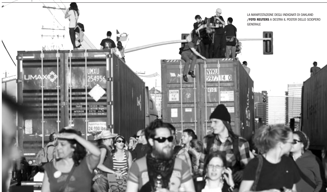
LA MANIFESTAZIONE DEGLI INDIGNATI DI OAKLAND A DESTRA IL POSTER DELLO SCIOPERO GENERALE