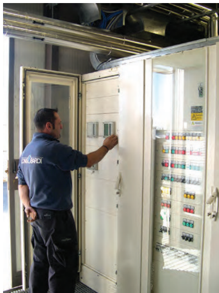
La Longobardi offre tutti i servizi legati alla climatizzazione degli edifici, grandi o piccoli che siano.