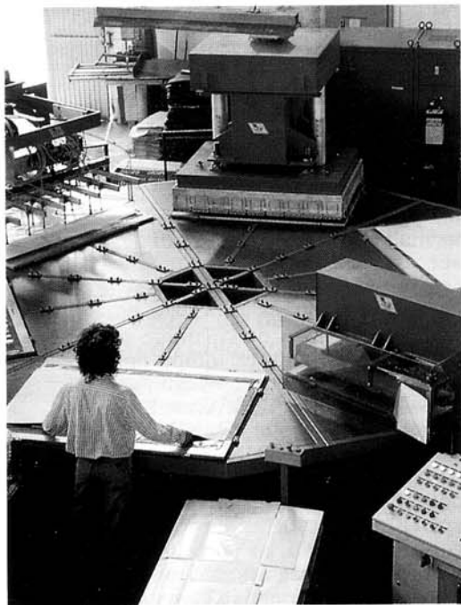
Nuove tecnologie per la produzione della scatola ORDIMETT.

gruppi privati e pubblici, quali Fiat, Iveco, Skf, Banche, Assicurazioni e