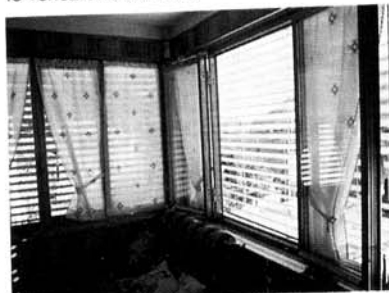
Finestre con le veneziane bordate