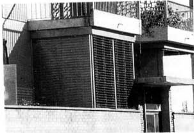
Veneziane bordate applicate in sostituzione delle tapparelle