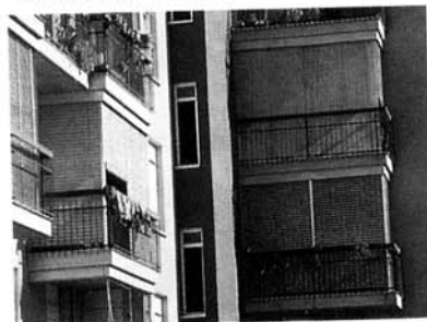
Estetica e praticità delle veneziane bordate