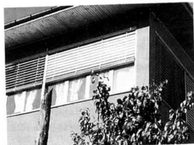
Realizzazione di nuovi ambienti con le veneziane bordate