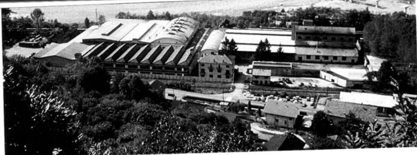
Lo stabilimento di Quarone Sesia.

venuta a creare tra la Fibro, come produttrice di pezzi finiti, e la Nuova Fast come detentrica delle tecnologie di trasformazione per tali prodotti. E' proprio nell'area cumianese che intendiamo investire nel prossimo futuro; sia per ampliare la base produttiva dell'azienda che per le aree di ricerca e di sviluppo prodotto con positivi benefici su di una occupa-