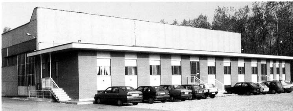
Cumiana: la sede della Fibro.