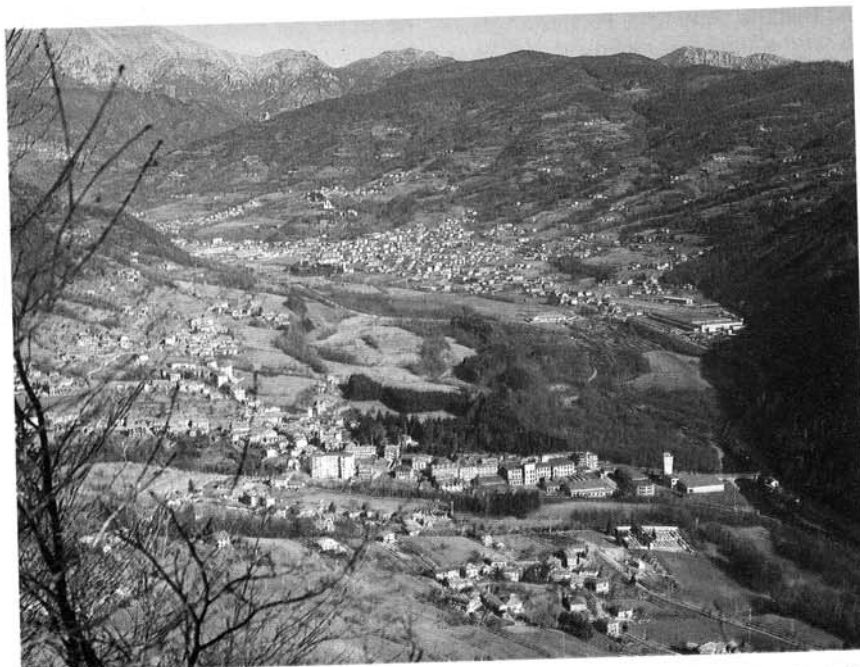
Una veduta dall'alto dell'area, nella Val Chisone, dove è situato lo stabilimento della Boge Italia (sulla destra, dove inizia la zona soleggiata).

Fondata su un nucleo iniziale di un'ottantina di collaboratori, già qualificati nel settore in quanto provenienti dalla Corte & Cosso, la BOGE, dal maggio '85, data in cui viene iniziata la produzione a Villar Perosa degli ammortizzatori a gas, alla fine dell'anno, aumenta le maestranze fino a raggiungere le 180 unità, con un fattu-