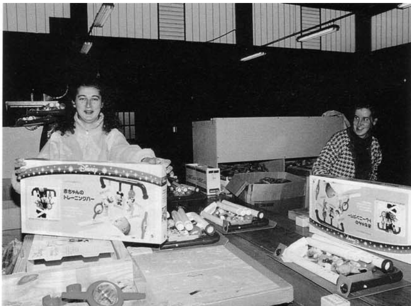
Il giocattolo finito viene confezionato, pronto per la vendita (nella foto la linea Disney destinata al Giappone).