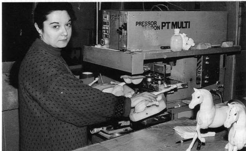
La rifinitura e l'incollaggio dei giocattoli.

fornitore di qualità. Il '91 è l'anno della ripresa, con gli oltre centomila giocattoli prodotti ed i quattordici dipendenti, il doppio dell'anno precedente.