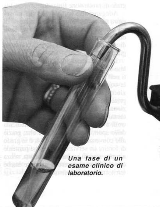
Una fase di un esame clinico di laboratorio.

Questo «Studio», che ha recentemente aumentato il capitale sociale portandolo dai 50 milioni iniziali a 99 milioni, è l'unica struttura privata non ospedaliera che, nel Pinerolese, è convenzionata per parecchi esami medici con il Servizio Sanitario Nazionale. Il cittadino che necessita di accertamenti clinici può così effettuare direttamente presso i locali del Grattaciolo esami di laboratorio a scopo di accertamento diagnostico, esami di radiologia generale, mammografie, ecotomografie, elettrocardiogrammi e visite di medicina sportiva. Una serie di servizi molto richiesti dall'utente che trova, pur rimanendo nell'ambito dei servizi coperti dall'assistenza mutualistica, una valida