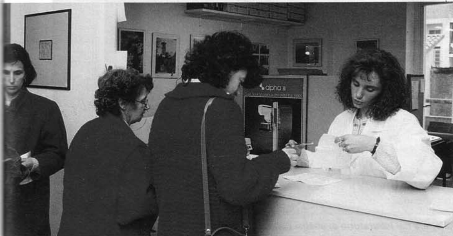
Si sbrogliano le pratiche relative all'accettazione.

Lo Studio Medico, per venire incontro alle sempre maggiori richieste, ha così cercato di adeguare la sua