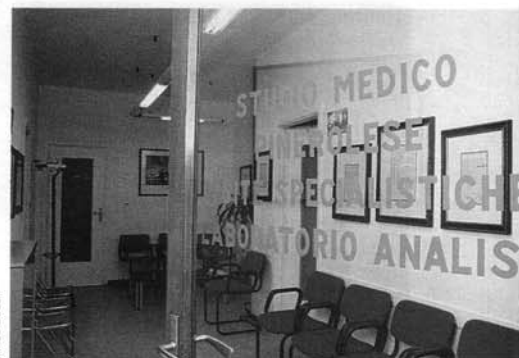
3° piano di via Chiappero 23: l'ingresso con la sala d'attesa.

Costituito nel gennaio del 1974 come Istituto Medico Pinerolese S.a.s., alla fine del primo anno di attività la società si è trasformata in S.r.l., modificando poi la ragione sociale in «Studio Medico Pinerolese» e ampliando le proprie competenze fino a raggiungere l'attuale struttura, con 6 dipendenti, un biologo, due tecnici di radiologia e ben 34 medici che coprono ogni settore specialistico.