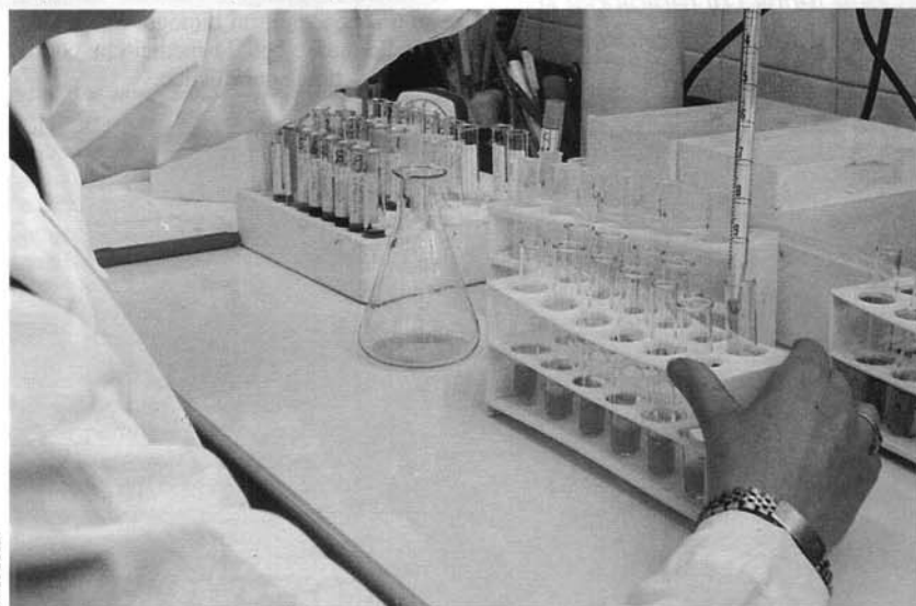
All'opera nel laboratorio di analisi cliniche.