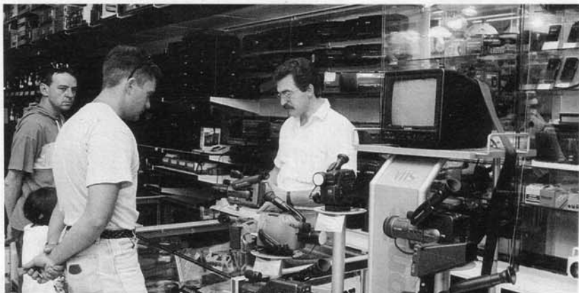
Nel reparto video.

Ma non si finisce a Pinerolo. E' infatti in fase di studio, nell'ambito del gruppo Expert, l'apertura di quattro aree specializzate nell'elettronica nelle province di Cuneo e Torino alle quali parteciperà anche la Chiale Snc. Un ulteriore biglietto da visita per rimanere al passo coi tempi.