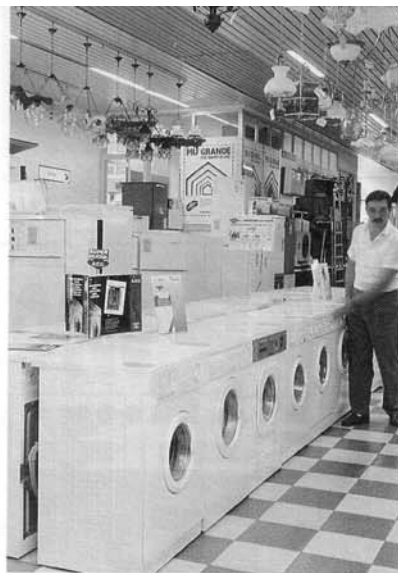
Da Chiale anche gli elettrodomestici.

Attualmente gli articoli trattati spaziano in tre grandi settori merceologici: quello degli elettrodomestici, che copre circa il 50% delle vendite, e quelli della ferramenta e dei casalinghi-liste nozze, che si ripartiscono in egual misura la parte rimanente. La specializzazione iniziale nel settore elettrodomestici, concentrata sul «bianco», è andata via via comprendendo, con l'ingres-