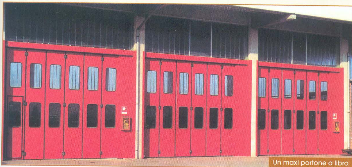
Un maxi portone a libro