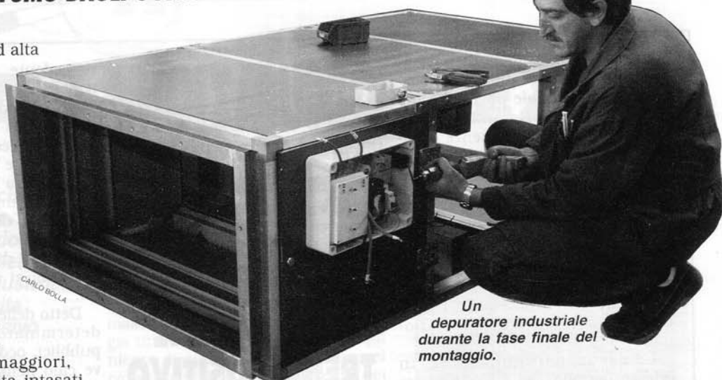
Un depuratore industriale durante la fase finale del montaggio.

Una scommessa che l'Aernova ha accettato e nella quale ha concentrato tutte le sue forze, riuscendo a differenziare sempre più la sua pro-