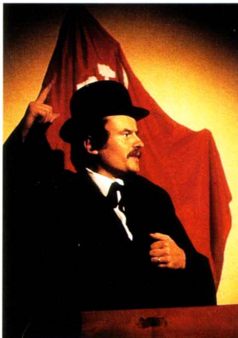
Il Gruppo teatro Angrogna ha messo in scena gli avvenimenti legati all'occupazione della Mazzonis nello spettacolo "Pralafera 1920".

«Gli avvenimenti di questi giorni – chiosò L'Eco, cercando una posizione di compromesso – dimostrano a luce chiarissima quanto sia deficiente e difettoso il regime che il liberalismo ha instaurato nel campo del lavoro: e quanto sia necessario rimediare ricorrendo non alle ingiuste e utopistiche teorie socialiste, ma alle grandi, organiche concezioni della sociologia cristiana» 5 . E indicò il neonato Partito popolare come punto di riferimento politico.