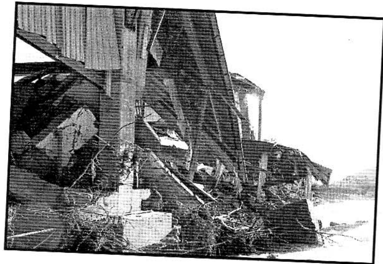
Palazzetto del ghiaccio.

Dovrà sorgere a Torre Pellice e non in altre parti del territorio, perché è qui che ha radici il fenomeno sportivo