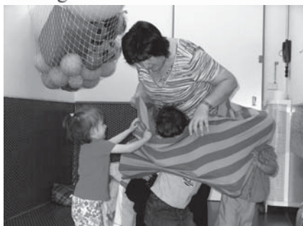
Dai 20 mesi

• cucina interna, cibi freschi e attenzione al biologico