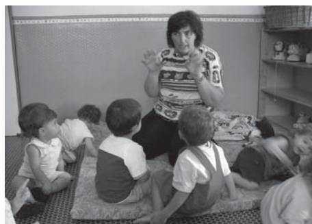
Da 0 a 3 anni

Con possibilità di incontri e momenti di riflessione per i genitori