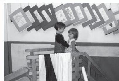
Da 0 a 1 anno

Due educatrici giocano e propongono attività varie