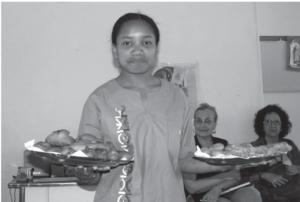
Brisette presenta alcune pietanze malgascse.