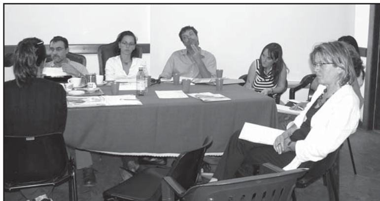
Gruppo di lavoro durante il seminario sul Turismo Responsabile a Torre Pellice