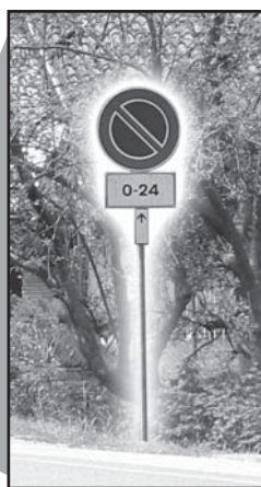
Arrivando da Pinerolo: a destra l'inizio del divieto di sosta, a sinistra l'indicazione del parcheggio