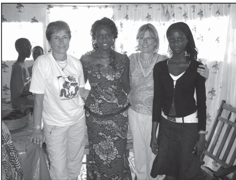
Le nostre amministratrici ospiti presso una famiglia di Lougà

Sono questi alcuni presupposti del turismo responsabile; gli operatori del turismo responsabile lavorano per promuovere nei turisti la consapevolezza del proprio ruolo di consumatori del prodotto-viaggio, da cui dipendono la qualità dell'offerta e il destino degli abitanti dei luoghi di destinazione. L'attenzione è quella di portare risorse a quei territori in un'ottica di equità sociale ed economica.