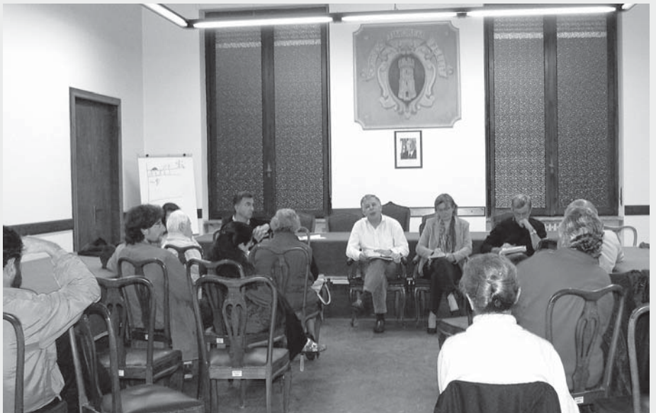
Incontro dell'Amministrazione con la popolazione in Sala Consiliare

Nel mese di Giugno, l'Amministrazione di Torre Pellice ha organizzato incontri con la popolazione per informare sul proprio operato, discutere dei problemi della città, raccogliere sollecitazioni e consigli.