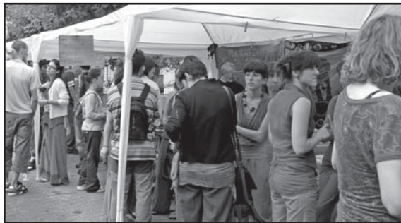
Piazza Muston - Pubblico numeroso in visita agli stand della festa

• l'associazione "Persone come noi" ha operato nei villaggi di Hikkaduwa e Palana e nella città di Tangalle con il sostegno diretto a circa 500 ragazzi/e frequentanti