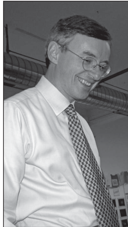
Lo storico Alessandro Barbero