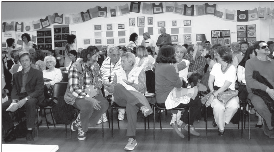
Il pubblico, durante la conferenza dello storico Alessandro Barbero