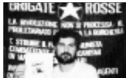
GIUSTIZIATO PECI 1981 Le Br rapiscono e uccidono per rappresaglia Roberto Peci, fratello di Patrizio, il primo grande pentito. Ripresa da una telecamera, l'esecuzione raggiunge forme particolarmente efferate