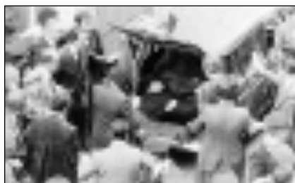
L'UCCISIONE DI BACHELET 1980 Il 12 febbraio all'Università di Roma viene ucciso Vittorio Bachelet, professore di diritto amministrativo, vicepresidente del Csm. L'omicidio avviene davanti all'aula di Scienze politiche intitolata a Moro