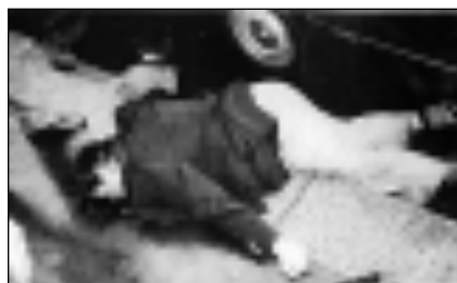
IL DELITTO TOBAGI 1980 Walter Tobagi, inviato speciale del "Corriere della Sera" è freddato a pochi passi da casa, mentre stava andando in redazione. Il delitto è rivendicato dalla Brigata 28 Marzo