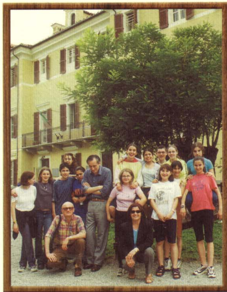
Giugno 2000, nel parco della Scuola Media di Buriasco, con la sua ultima classe