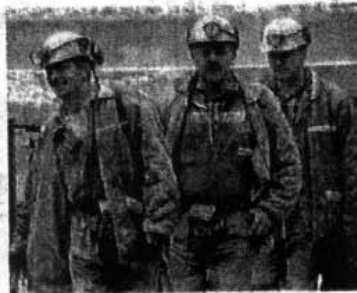
RODORETTO È la valle dove si trova la miniera di talco di Prali che a inizio del '900 dava lavoro a più di 300 operai. Oggi sono appena 27

A PRALI, per ricordare agli abitanti le proprie radici c'è una rotonda stradale: in mezzo ci sono le sagome di due minatori, uno piccona e l'altro traina un carrello. Padri, nonni e avi, del paese e di buona parte della val Germanasca, hanno messo su famiglia grazie alla miniera di Rodoretto, che oggi produce 30 mila tonnellate di quello che per molti è il talco migliore al mondo. Grandi nomi della cosmetica mondiale (più importanti produttori del settore cosmetico e farmaceutico, oltre a produttori di materie pla-