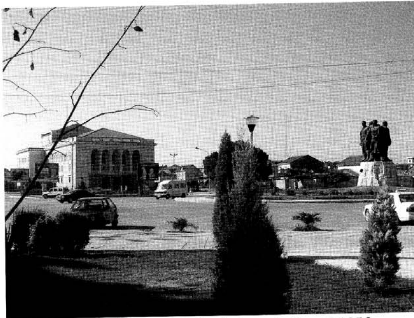
Il Teatro della città di Scutari, costruito nel 1958, intitolato a Migjeni.

Nel dopoguerra, durante il regime comunista-paranoide di Enver Hoxha, Migjeni è stato esaltato come il precursore del realismo socialista per la radicalità del suo rifiuto del mondo "vecchio".