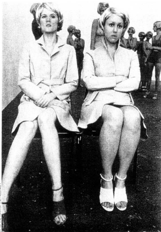
VANESSA BEECROFT Performance, 1996

« D ELPHINE E ALESSANDRO: gran matrimonio alla francesca», aveva pubblicato in prima pagina Paris Match , nel settembre 2005. «Per la felicità di sua figlia, Bernard Arnault riceve al castello d'Yquem principi, star e baroni della finanza.» Alla sua diletta aveva of-