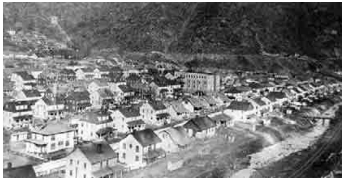
In alto, una mappa del Kentucky; qui a sinistra, una veduta della città di Harlan

Nonostante la disoccupazione, la droga e lo scoraggiamento