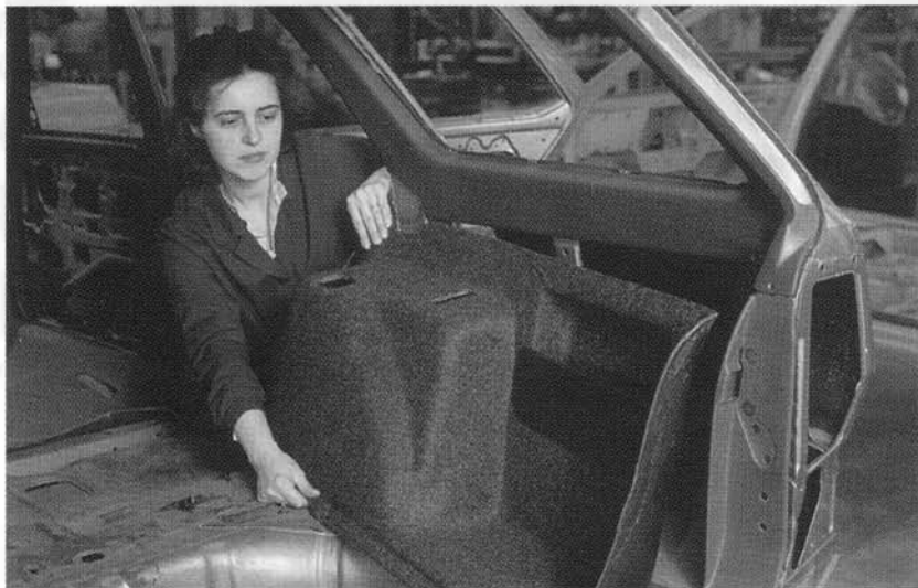
Una fase del controllo dimensionale di un passaruota sulla scocca di un'auto.

a dotarsi di impianti ad alta tecnologia per il riciclaggio dei materiali usati.