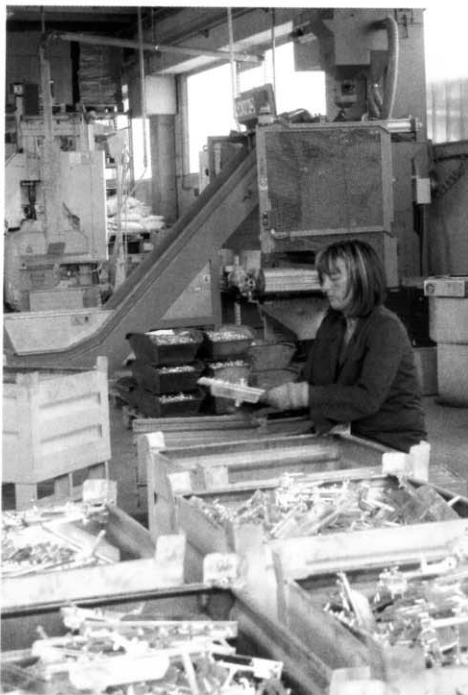
Quindici i dipendenti: non è facile trovare manodopera già formata