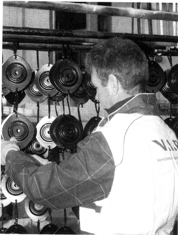
Una fase dell'operazione di verniciatura

Ma c'è anche tempo per gli hobby. Curiosando