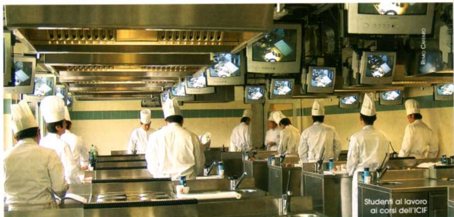
Studenti al lavoro ai corsi dell'ICIF