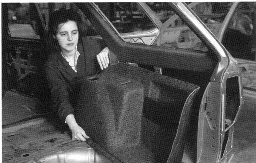
Una fase del controllo dimensionale di un passaruota sulla scocca di un'auto.

a dotarsi di impianti ad alta tecnologia per il riciclaggio dei materiali usati.