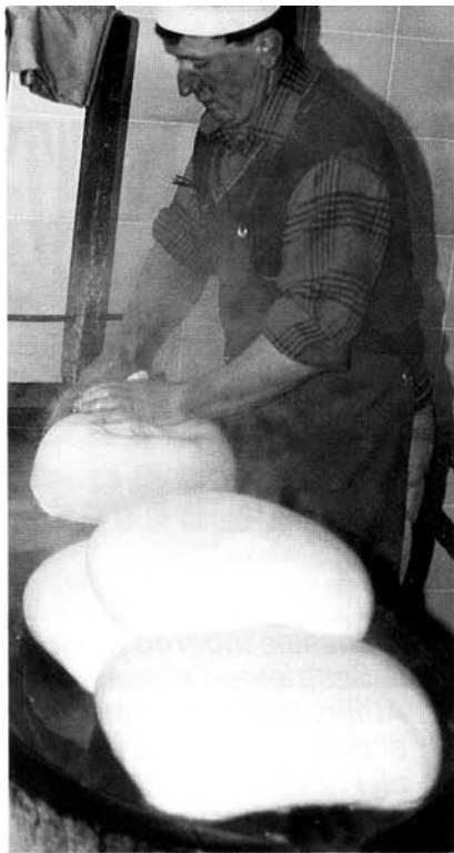
Si lavora a mano la pasta cagliata.