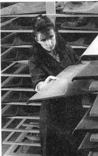
Lo stoccaggio dei prodotti finiti.