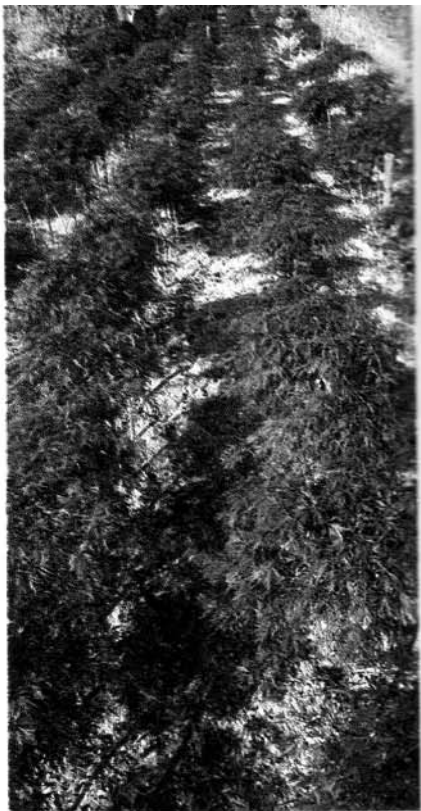
Migliaia di aceri giapponesi da Crespo & Figli.