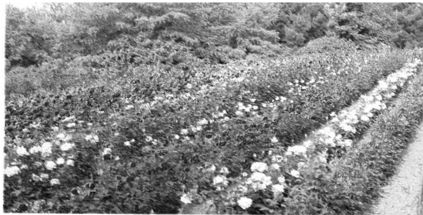
Le rose sono sempre attuali.

«Sembra un po' passata la moda delle piante in colore; ora si va sui colori naturali, sulle piante selvatiche a foglia caduta, come i faggi ed il platano. Un consiglio: mai mettere la pianta a dimora in una buca profonda; le radici andrebbero