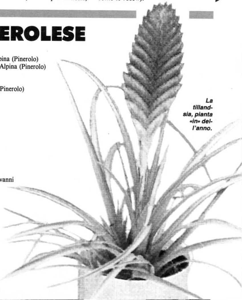
La tillandsia, pianta «in» dell'anno.