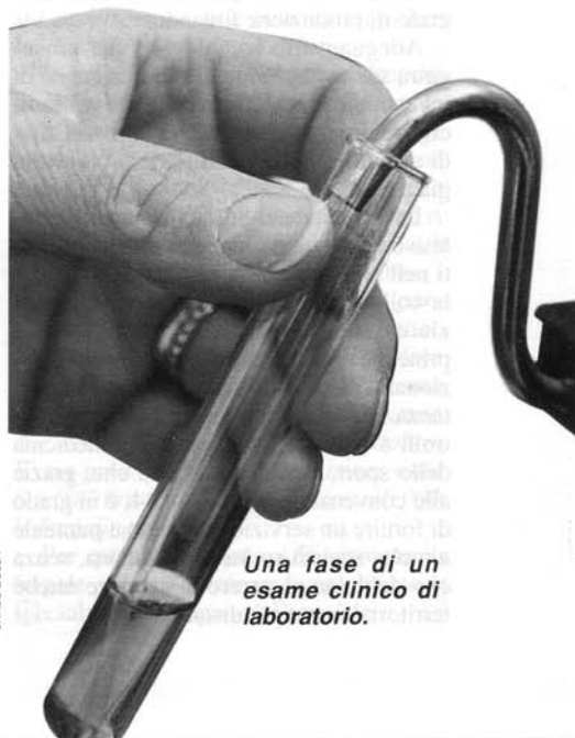
Una fase di un esame clinico di laboratorio.

Questo «Studio», che ha recentemente aumentato il capitale sociale portandolo dai 50 milioni iniziali a 99 milioni, è l'unica struttura privata non ospedaliera che, nel Pinerolese, è convenzionata per parecchi esami medici con il Servizio Sanitario Nazionale. Il cittadino che necessita di accertamenti clinici può così effettuare direttamente presso i locali del Grattaciolo esami di laboratorio a scopo di accertamento diagnostico, esami di radiologia generale, mammografie, ecotomografie, elettrocardiogrammi e visite di medicina sportiva. Una serie di servizi molto richiesti dall'utente che trova, pur rimanendo nell'ambito dei servizi coperti dall'assistenza mutualistica, una valida