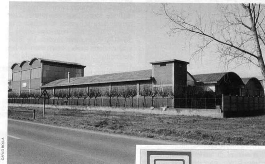
La Reco di Frossasco dalla Statale dei Laghi di Avigliana.

gente si sia fermata così - viaggiando - ed abbia deciso per strada di stabilire una propria attività.