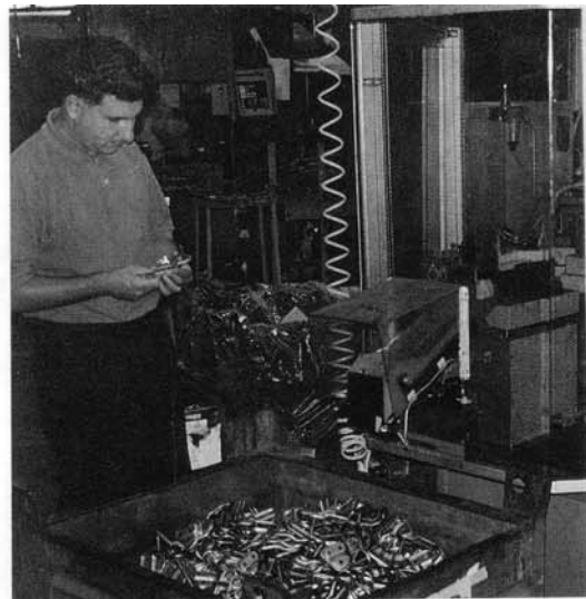
Una delle fasi di lavorazione della lamiera.

Il prodotto finito è principalmente destinato all'industria automobilistica torinese, cosicché i principali clienti risultano, oltre alla Fiat stes-