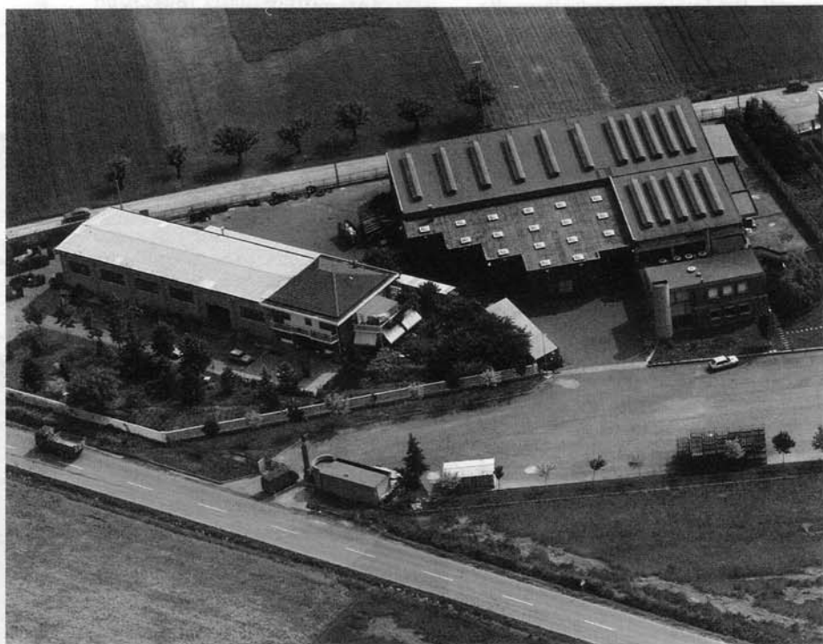
La «Pesce» vista dall'aereo.