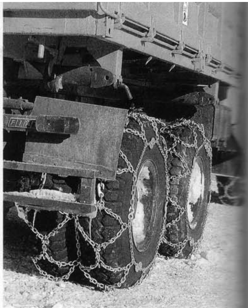
Le catene Pesce montate su un autocarro.

A dare l'avvio a questa attività, sicuramente all'avanguardia per l'epo-