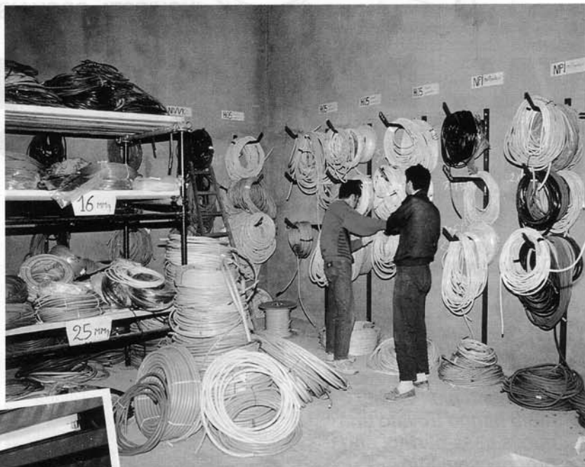
In alto: Al lavoro nel deposito cavi.

Proprio la Fiat, i cui rapporti sono iniziati con lo stabilimento di Villar e poi sono proseguiti con quelli di