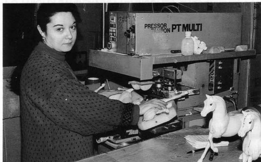
La rifinitura e l'incollaggio dei giocattoli.

fornitore di qualità. Il '91 è l'anno della ripresa, con gli oltre centomila giocattoli prodotti ed i quattordici dipendenti, il doppio dell'anno precedente.