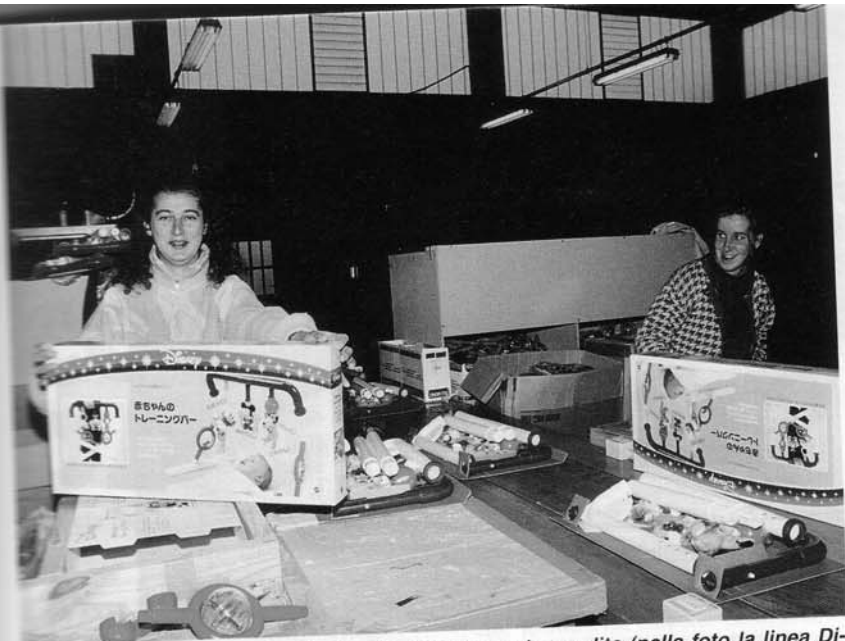
Il giocattolo finito viene confezionato, pronto per la vendita (nella foto la linea Disney destinata al Giappone).

lavorare inizia nel mese di febbraio per poi intensificarsi nel periodo aprile-novembre, quando i macchinari destinati allo stampaggio viaggiano 24 ore su 24 e le ragazze delle cooperative, addette all'assemblaggio e all'imballaggio, lavorano su due turni.