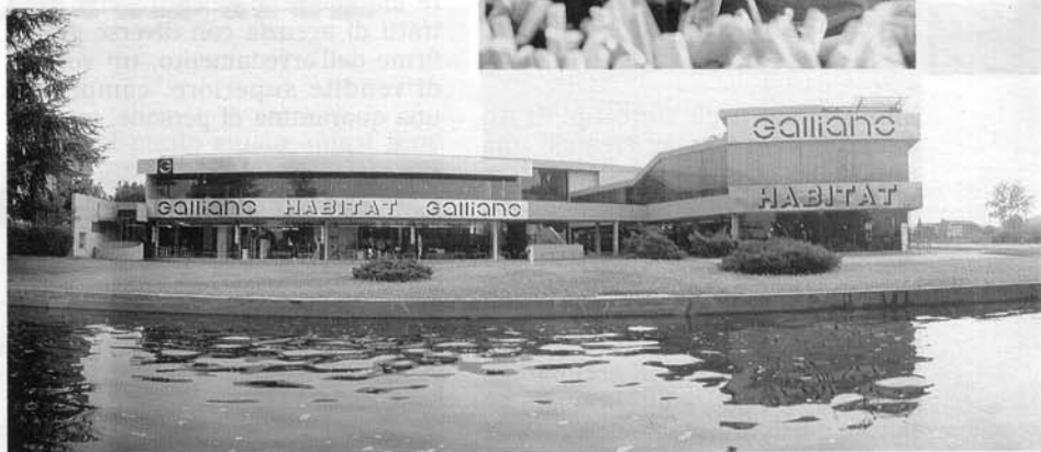
Il moderno showroom di None, sulla Statale del Sestrieres, dove ha sede l'azienda. Foto in alto: L'arch. Pepe Tanzi, la "griffe" della linea "Op Top".

centro europeo dell'innovativa e rivoluzionaria idea "Op Top".