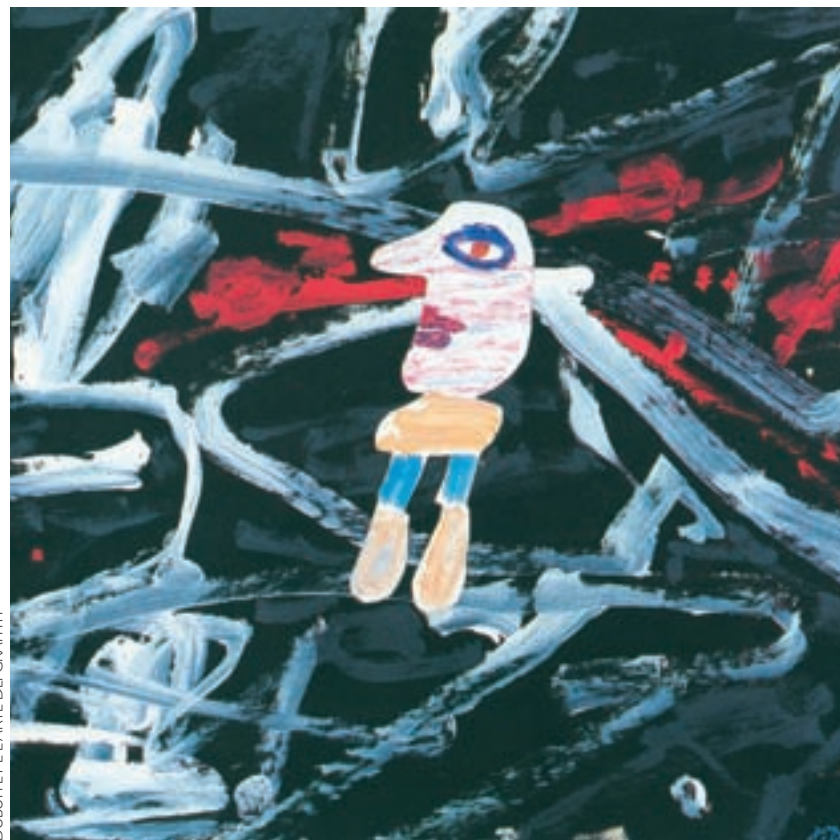
DUBUFFET LE PARTIE DE GRAFFITI

In tutti e tre i casi, il principale strumento di gestione è l'ipocrisia. Dopo aver nascosto i punti deboli – impossibilità di «cartolarizzare» i debiti senza rendere insolubile il sistema finanzia-